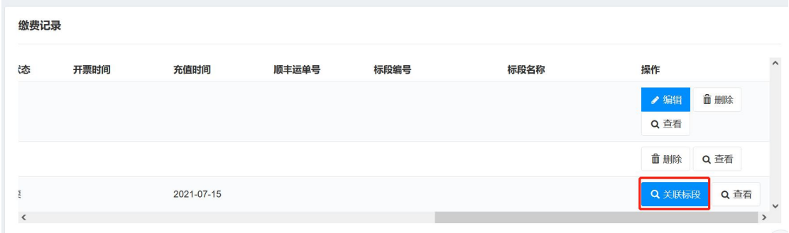
图 7 平台使用服务费次费关联项目

7. 按次缴费的供应商，缴费成功后在缴费记录中点击【关联标段】按钮，选择所参加的项目进行关联方可正常享受次费权益。