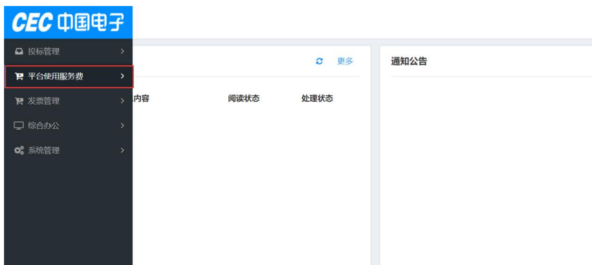
图 2 平台使用服务费菜单

2. 供应商进入平台使用服务费缴费页面后点击【收费标准】按钮查看平台收费标准，以便按需缴费。